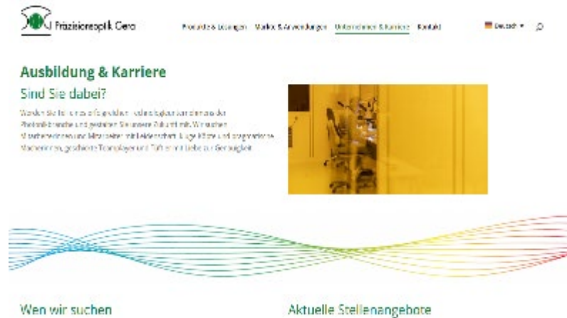
Beispiel Unternehmenskarriereseite von POG