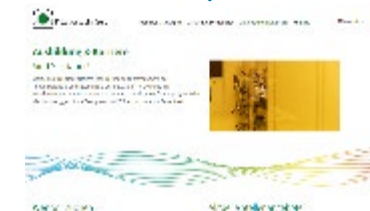
Karriere- seiten der Unternehmen